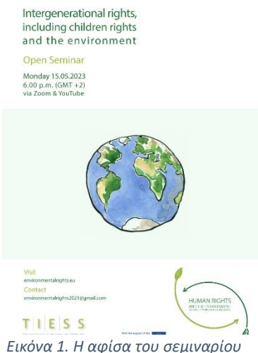
Εικόνα 1. Η αφίσα του σεμιναρίου

Η Savic εστίασε στις πιθανές εντάσεις μεταξύ των παρόντων και των μελλοντικών γενεών λόγω ανταγωνιστικών προτεραιοτήτων, ενδιαφερόντων και χρονικών πλαισίων. Συζήτησε επιλογές και πιθανά αντισταθμίσιμα μεταξύ των άμεσων αναγκών και των επιθυμιών των μελλοντικών γενεών, οι οποίες συνδέονται με βραχυπρόθεσμα οφέλη, και άμεσης ικανοποίησης τρέχουσων επιθυμιών έναντι καθυστερημένης ανταμοιβής έναντι μακροπρόθεσμων αναγκών. Επισήμανε την