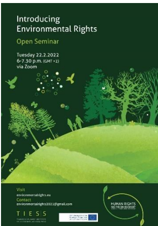
Εικόνα 1. Η αφίσα του σεμιναρίου

Το πρώτο σεμινάριο επικεντρώθηκε στην εισαγωγή της έννοιας των περιβαλλοντικών δικαιωμάτων. Τα ανθρώπινα δικαιώματα και η περιβαλλοντική αειφορία είναι άρρηκτα συνδεδεμένα. Ένα υγιές, ασφαλές και παραγωγικό περιβάλλον είναι απαραίτητη προϋπόθεση για την απόλαυση των περισσότερων ανθρωπίνων δικαιωμάτων, και ταυτόχρονα, τα ανθρώπινα δικαιώματα μπορούν να αποτελέσουν σύμμαχο στην πορεία προς την επίτευξη περιβαλλοντικής βιωσιμότητας.